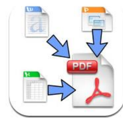
Office To PDF

אפליקצייה זו הינה בתשלום חד פעמי של $4.99 לחברת אפל. ניתן להוריד אותה ישירות מ - App Store. חפשו OfficeToPDF או לחצו על הלינק .