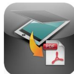
Scan To PDF

אפליקצייה זו הינה בתשלום חד פעמי של $2 לחברת אפל. ניתן להוריד אותה ישירות מ - App Store. חפשו ScanToPDF או לחצו על הלינק .